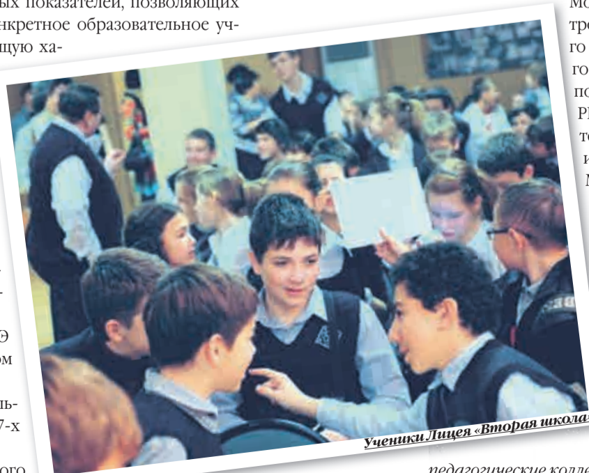
Ученики Лицея «Вторая школа»

В начале сентября в Москве был также представлен рейтинг «500 лучших школ России», разработанный Московским Центром непрерывного математического образования при поддержке Группы РИА Новости, «Учительской газеты» и при содействии Министерства образования и науки РФ. В рейтинг вошли 89 московских школ. Семь из них оказались в числе двадцати пяти лучших. Среди них – Лицей «Вторая школа».