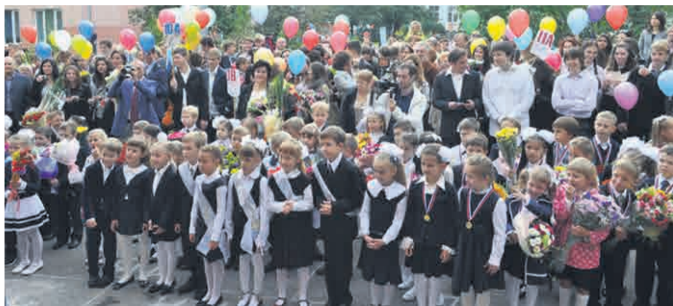
1 сентября 2013 года в школе № 1260

Многое изменилось за 55 лет в нашем городе и районе, вводятся в строй новые и реконструируются старые школы, существенно обновляется их материальная база.